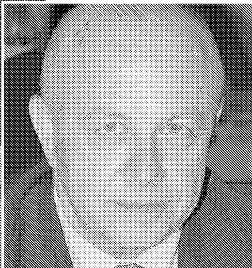
Qui sopra Massimo Bortolotti, presidente di Fiaip Bologna