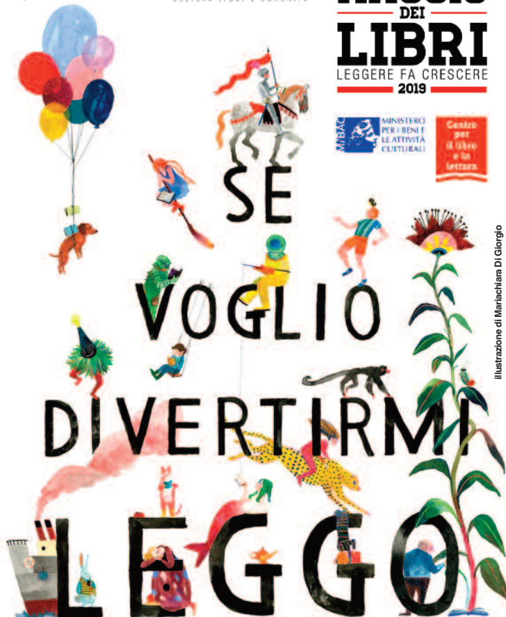
Illustrazione di Mariachara Di Giorgio