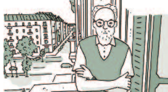
Illustrazione di P. Scamera