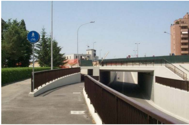
Il sottopassaggio pedonale e ciclabile tra la zona Meridiana e la stazione Ceretolo