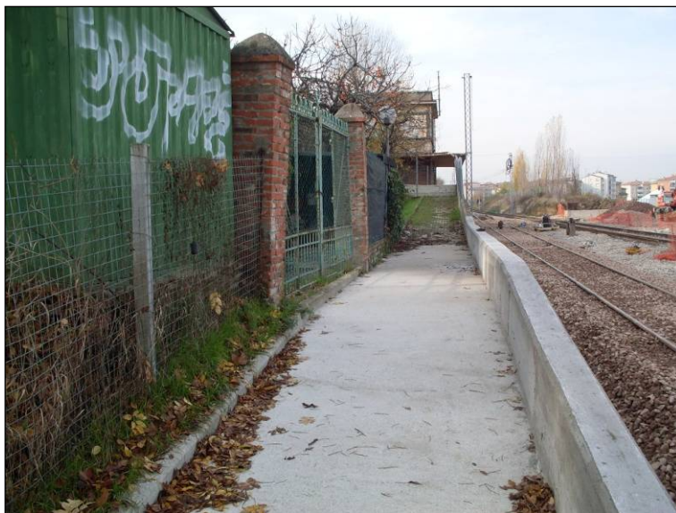
Il passaggio pedonale tra la stazione Ceretolo e via del Carso

Recentemente, con i lavori di allargamento dell'autostrada A1, di fianco al ponte ferroviario è stato realizzato anche il collegamento pedonale e ciclabile che ha messo in connessione Ceretolo alla stazione tramite un percorso pedonale che arriva fino a via del Carso, nei pressi della vecchia stazione ferroviaria oggi dismessa. Arrivati a questo punto, il percorso in sede propria finisce. Per proseguire verso Zola è necessario raggiungere via Sabotino passando per via Bazzanese.