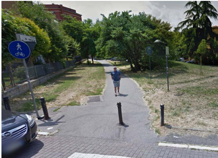
Vicolo Baldo Sauro nella zona dell'Ex Galoppatoio