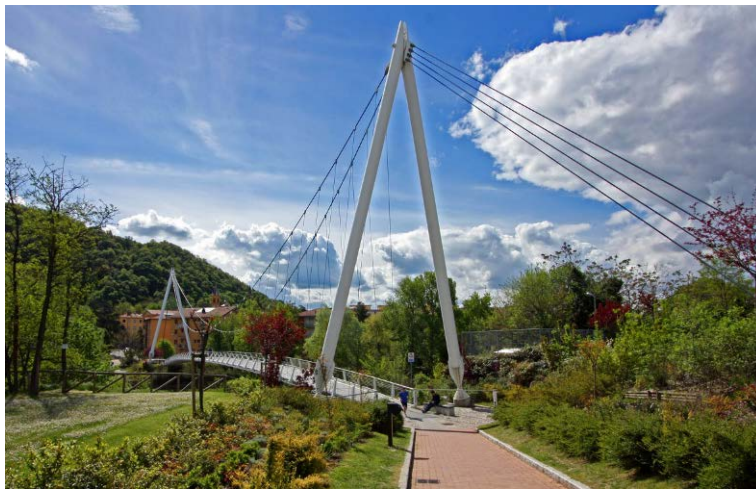
Il ponte pedonale "della Pace" sul fiume Reno

Nel 2004 in occasione della realizzazione del nuovo Municipio, il Comune di Casalecchio ha realizzato un ponte pedonale per collegare le due sponde del fiume Reno, dalla zona di via del Canale alla zona di via dei Mille. Da qui, percorrendo via Ugo Bassi, è possibile raggiungere la pista ciclopedonale che porta, in sede propria, al quartiere Meridiana. Per questo il PGTU prevede di modificare la circolazione di via Ugo Bassi in modo da ricavare anche in questa strada, un tratto di pista ciclabile in sede propria.