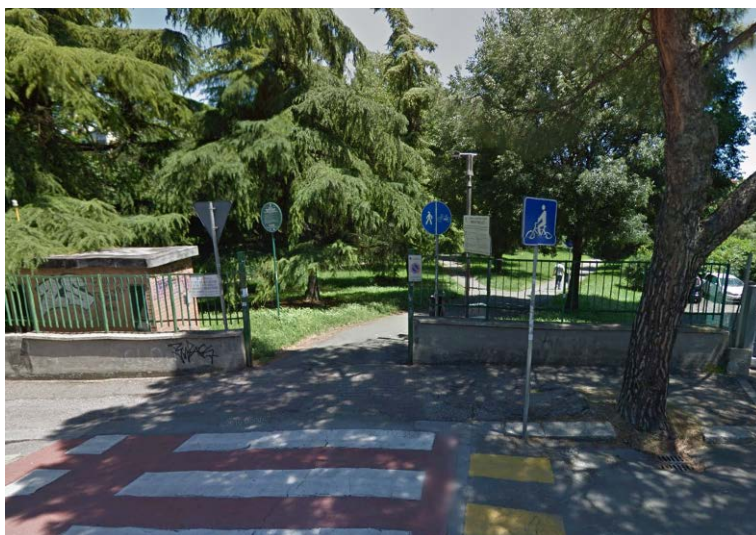
La pista ciclopedonale che proviene dal Parco Zanardi e attraversa via Caravaggio

Il percorso parte dal parco pubblico Zanardi al confine con Bologna e raggiunge il tracciato dismesso della ferrovia Bologna-Vignola passando per il parco "Ex Galoppatoio" e attraversando alcune strade locali in cui sono stati fatti degli interventi di moderazione della velocità.