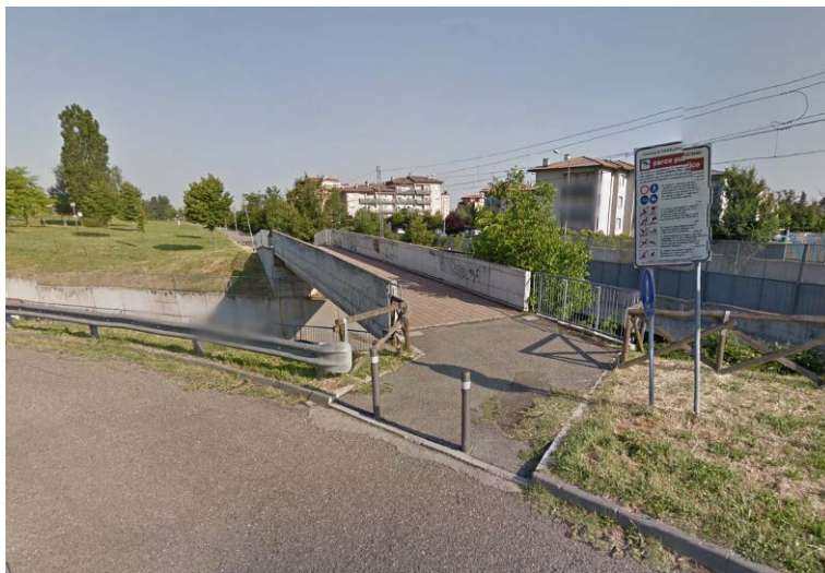
Via Sabotino: l'inizio del percorso pedonale e ciclabile verso Zola Predosa