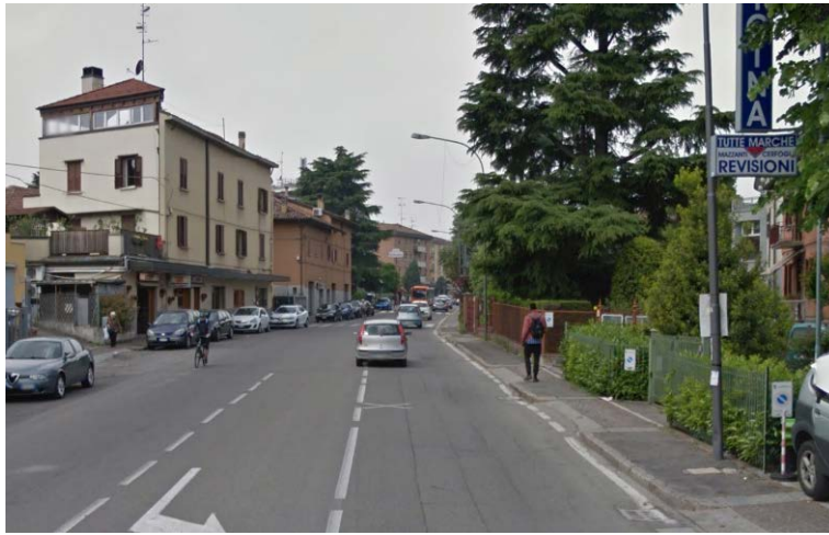
La via Bazzanese tra via del Carso e via Sabotino