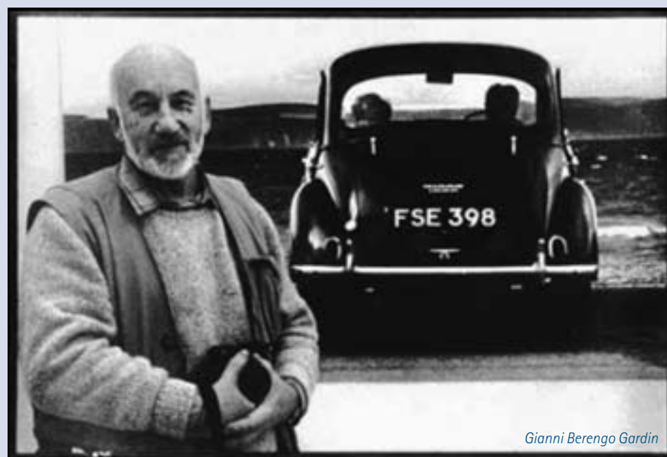
Gianni Berengo Gardin