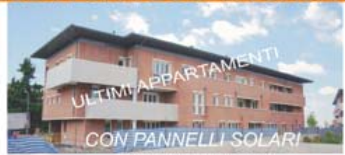
ZOLA PREDOSA - Riale

UFFICIO VENDITE IN LOCO: riceviamo in via CILEA il MARTEDI' e GIOVEDI' 16,00 - 18,00 e il SABATO 9,30 - 12,00