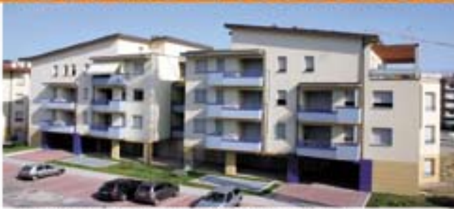
CASALECCHIO DI RENO - San Biagio

ABBIAMO LA SOLUZIONE PER LA VENDITA DELLA TUA VECCHIA CASA