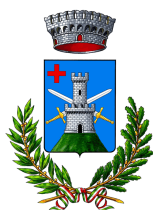
Monte San Pietro