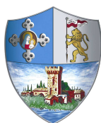
Casalecchio di Reno

Coffee break offerto da MELAMANGIO Servizi di ristorazione