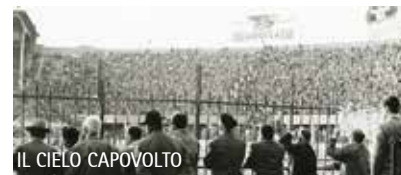
IL CIELO CAPOVOLTO